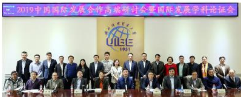
(供稿审核人: 王培志)

此次会议的举办旨在探究中国特色国际发展合作理论, 加强国际发展合作基础和政策研究, 探索跨学科的、体现鲜明时代特色的国际发展合作专业建设, 探讨本科生、研究生国际发展合作人才培养机制, 推动我国高校国际发展合作学科建设。会议加强了我校与政府、企业和校外研究机构专家学者的沟通与交流, 促进我校国际发展合作学科的建设与发展。