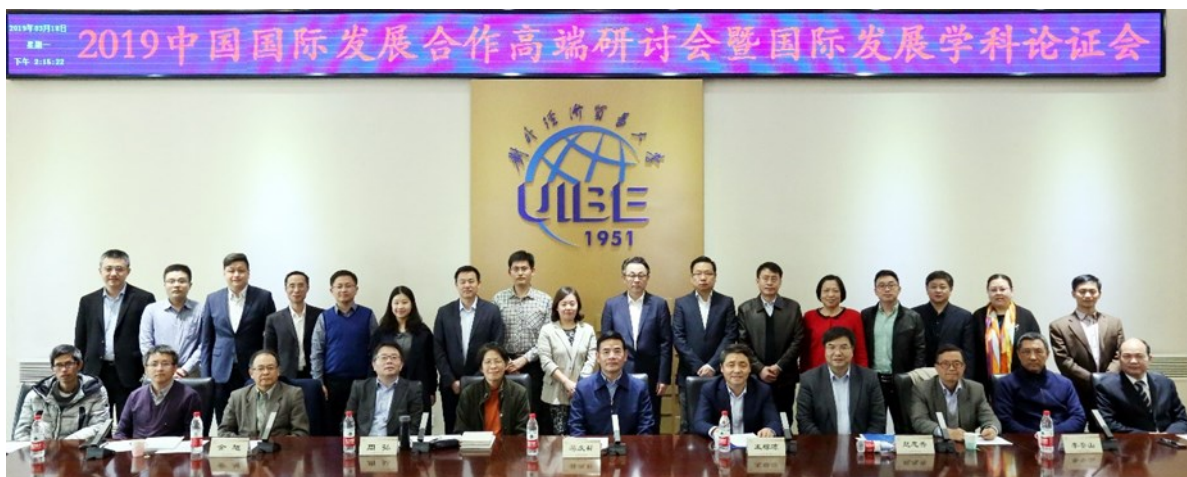
(三) 学校举办中国对外援助70周年回顾与展望暨国际发展合作学术研讨会